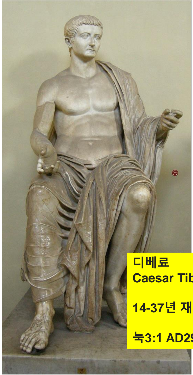
디베료 Caesar Tiberius 14-37년 재위 눅3:1 AD29년 세례요한