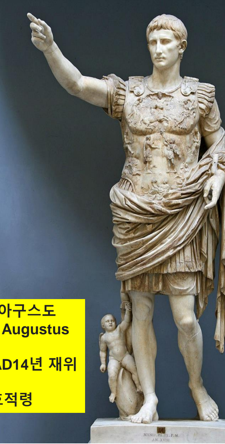
가이사 아구스도 Caesar Augustus BC27-AD14년 재위 눅2:1 호적령